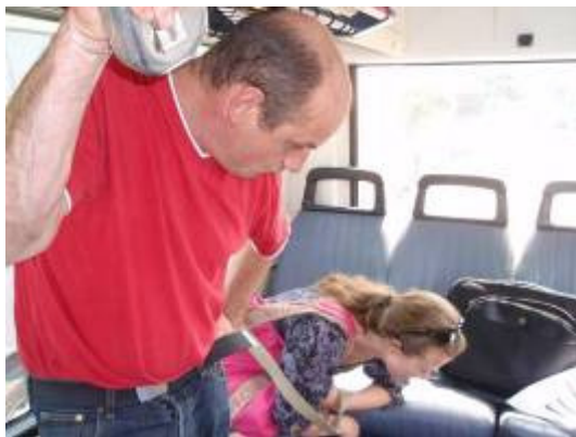
Architectenbureau Bollen en van Dillen

Bovendien wilden ze vervreemding teweeg brengen door de toeschouwer achterstevoren in de bus te plaatsen en alle vlakken scheef te laten lopen.