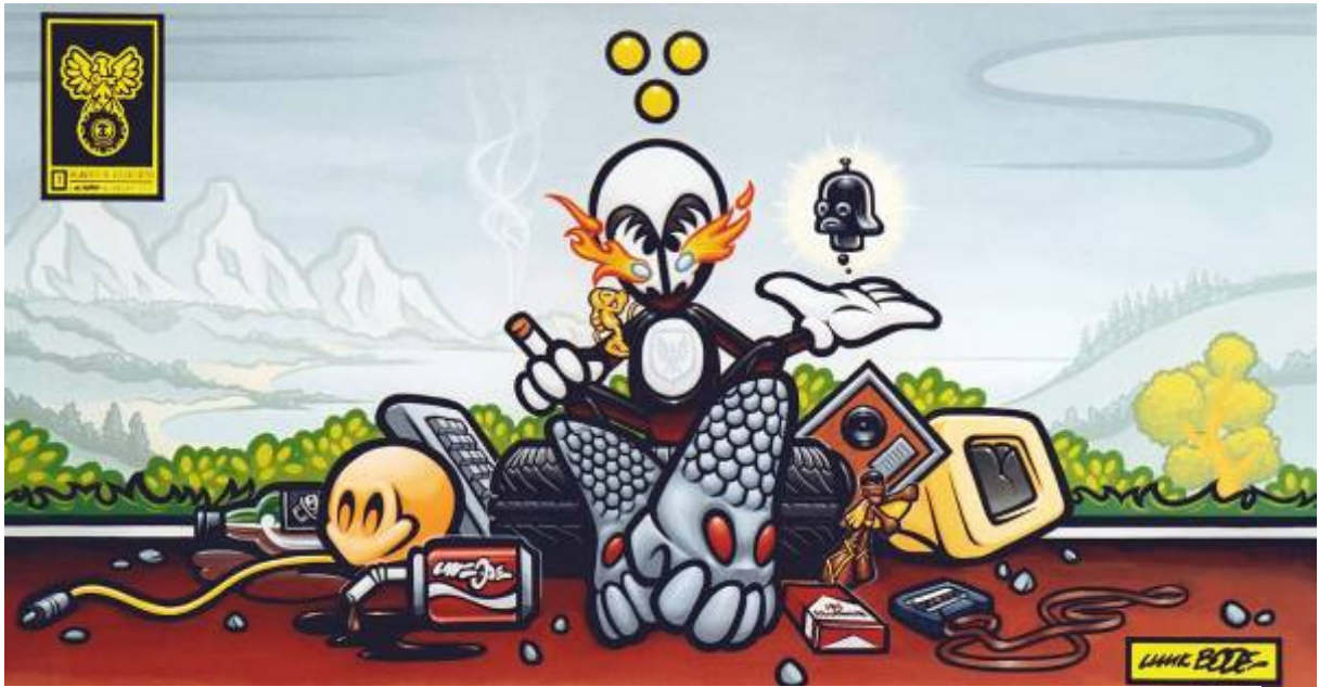
Luuk Bode, grafiek