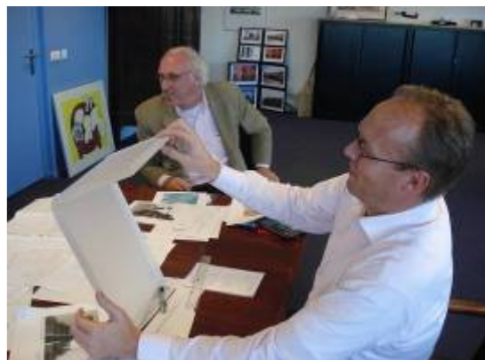
In gesprek met Talboom BV over de bankjes