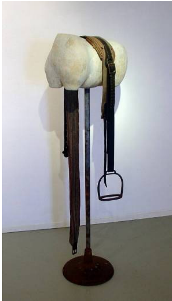
Jalal Alwan, beeldend kunstenaar