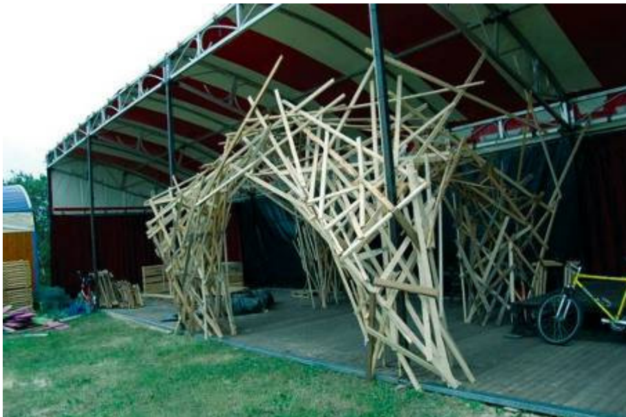
Autonoom kunstenaar Thijs Masthoff