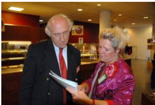
Op de Bredase beursvloer

We hebben Talboom bv Kunststofverwerking warm gekregen voor ons project. Heel erg blij zijn we met hun toezegging om de bankjes, gemaakt van Satal en de vitrinekasten, gemaakt van Acryl glas, te sponsoren. De tekeningen zijn besproken en een proefbankje is al klaar.