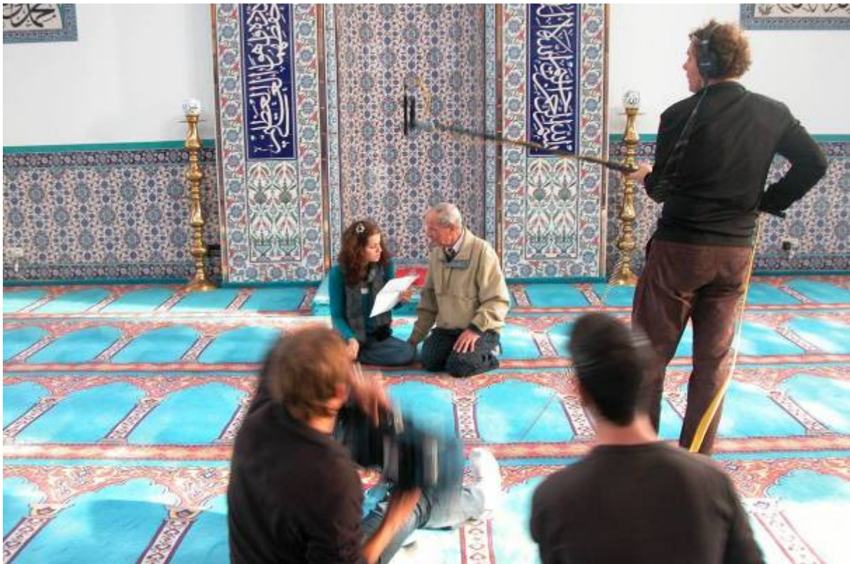
Movedmedia maakt filmopnamen in de moskee

De opnamen zijn soms ontroerend maar ook vrolijk. Het raakt aan allerlei emoties. Het zal niet eenvoudig zijn om de film te monteren naar 20 minuten. MOVED Media, die tevens sponsor is gaat er een prachtige kunstfilm van maken.