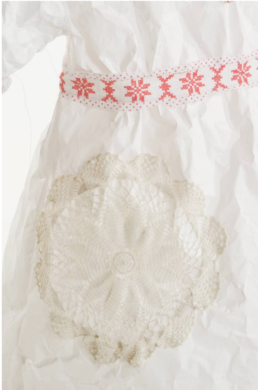
Detail 'Gewoon Wit'