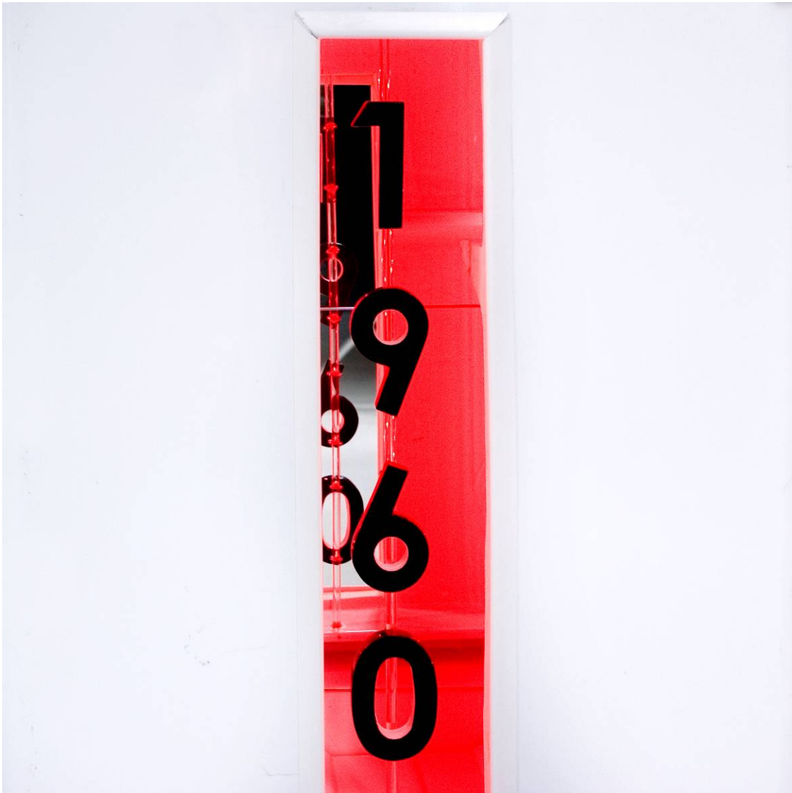
Detail van ' 1960