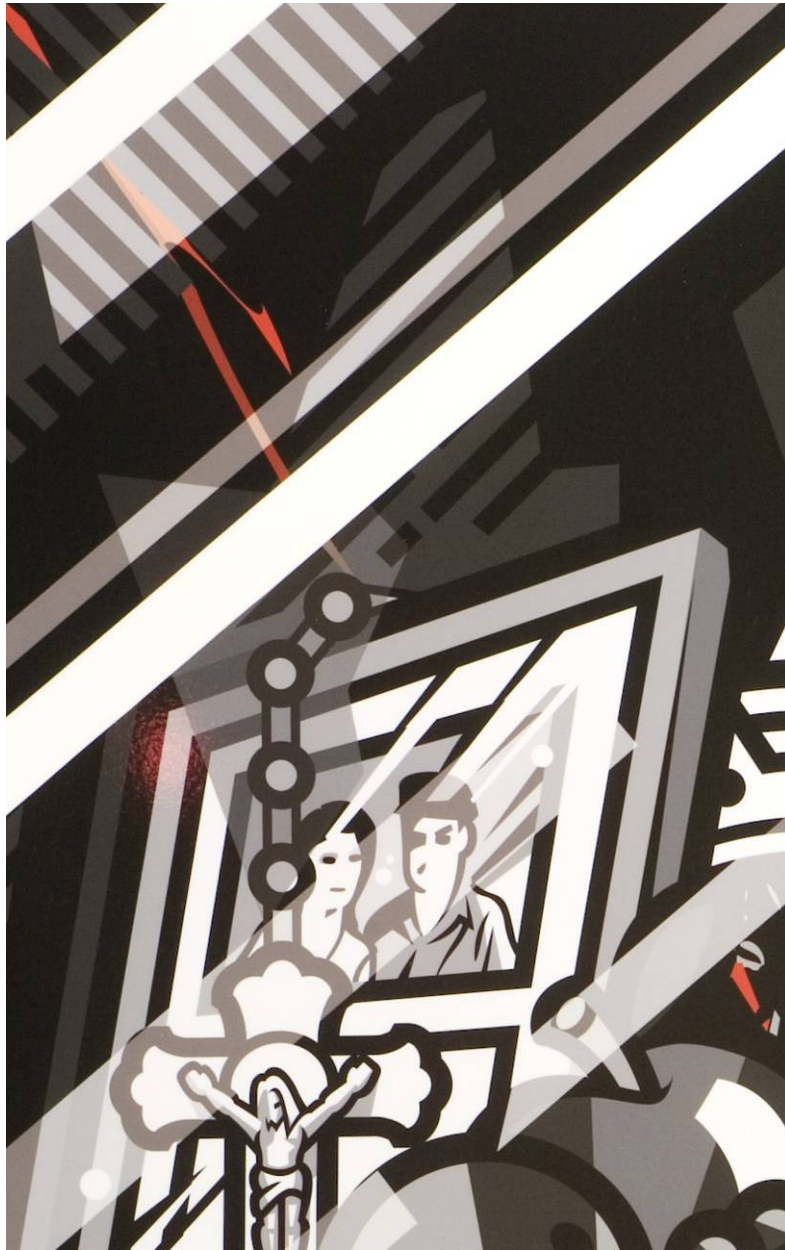
Detail uit 'Stilleven I'