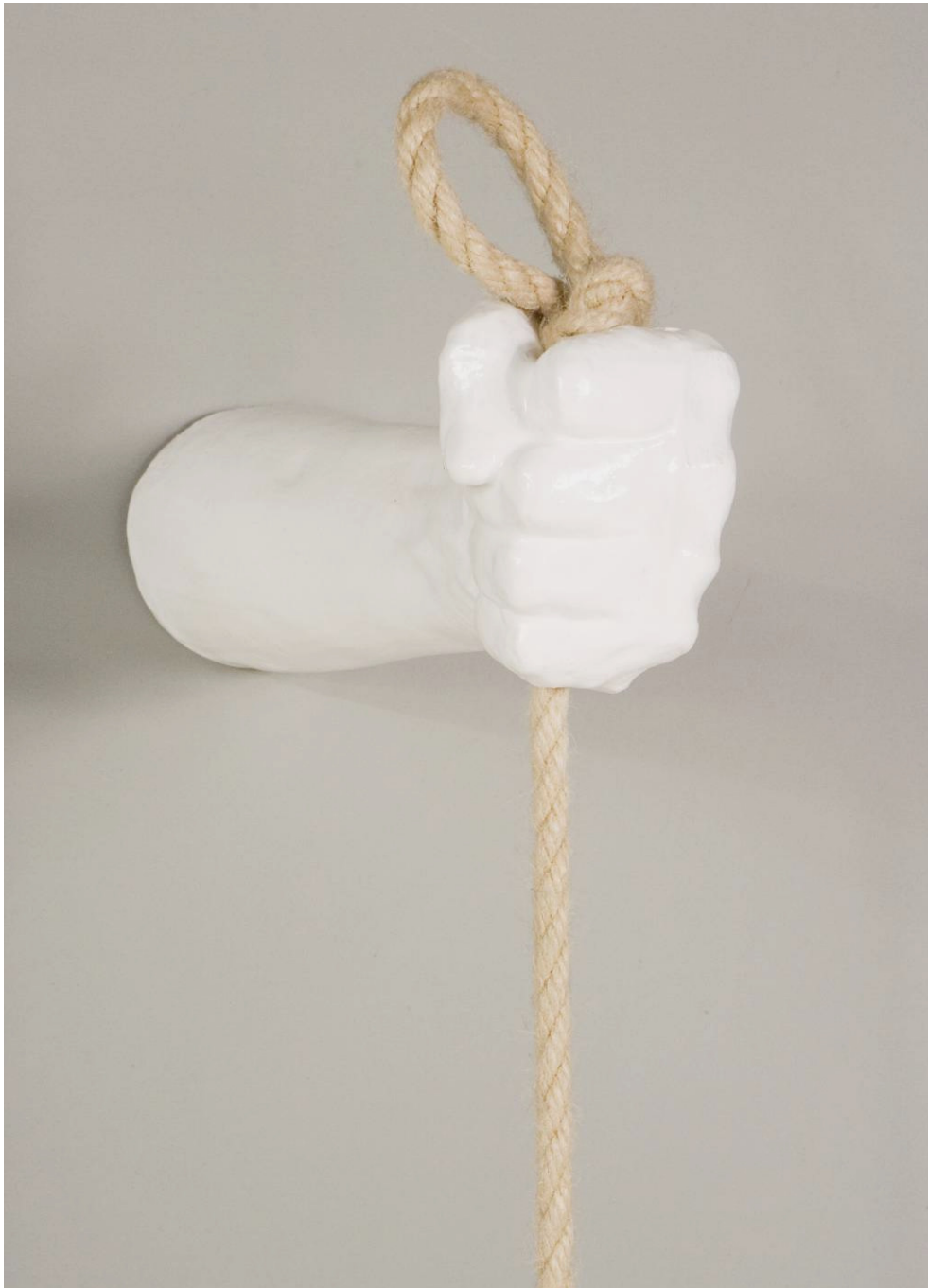
Detail van ' Het Schommelen'