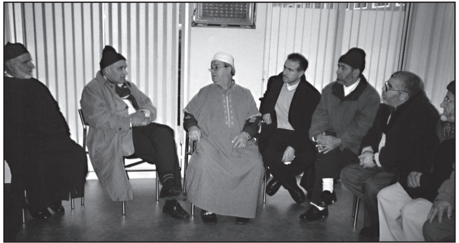
De Mekân ouderen in gesprek met bewoners van Dar Assalam.

De Marokkaanse ouderen van Mekân waren erg enthousiast over het uitstapje en gemotiveerd om deel te nemen aan het opzetten van een initiatiefgroep die de mogelijkheden onderzoekt voor een Marokkaanse woonzorgcomplex in Rotterdam.